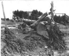
El puente para peatones que unía Montserrat con Balnear, también destruido por las aguas.