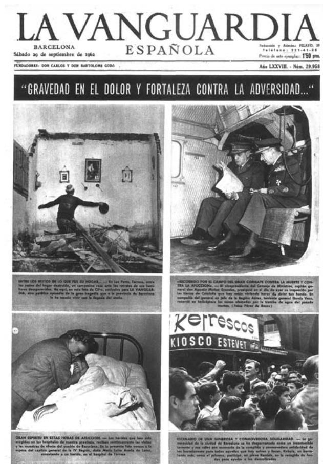
Portada de "La Vanguardia" del 29 de setembre de 1962