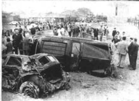
En Sabià, las aguas arrastraron vehículos automotrices hasta el final de la Rambla, donde se estacionaron en un tiempo de calma.