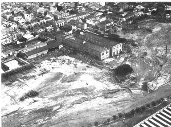
Portada de "La Vanguardia" del 28 de setembre de 1962