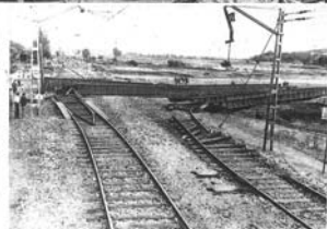
Las pasadas del ferrocarril de Montserrat y de Balnear, fueron también y destruidas por los efectos del tempor.