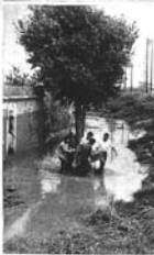
En San Adrià, las viviendas se vieron obligadas a estar al nivel de las aguas, ante el desbordamiento del Besòs.